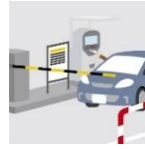
出口精算機で精算